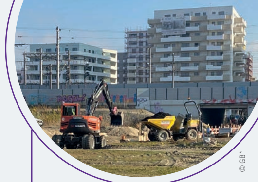
Baustelle an der Bruno-Marek-Allee

Kommen Sie mit Ihren Anregungen und Ideen zu uns!