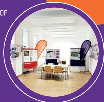
Unser Lokal in der Nordbahnstraße

Hier bleiben Sie auf dem Laufenden: www.gbstern.at/newsletter