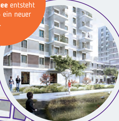
© AllesWirdGut Architektur / Riviera Moretti

Zwischen Hirschstetten und Breitenlee entsteht bis 2025 ein neuer Stadtteil.