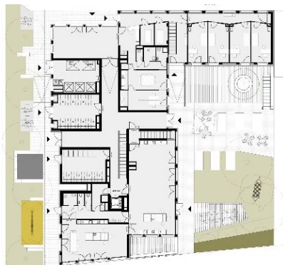
EG-Grundriss und Schaubild C.22.A © einzueins architektur