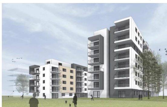
Schaubild 2 C.17.D