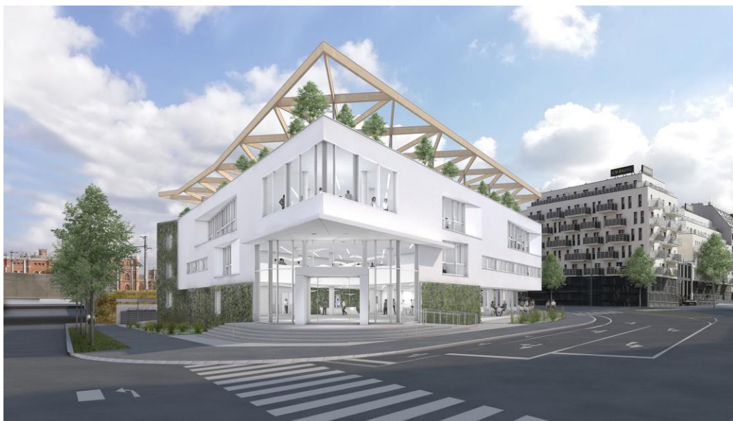
Schaubild C.10.A

Hr. DI Blaskovits/IC Development T: 01/217 121 806 E: c.blaskovits@value-one.com