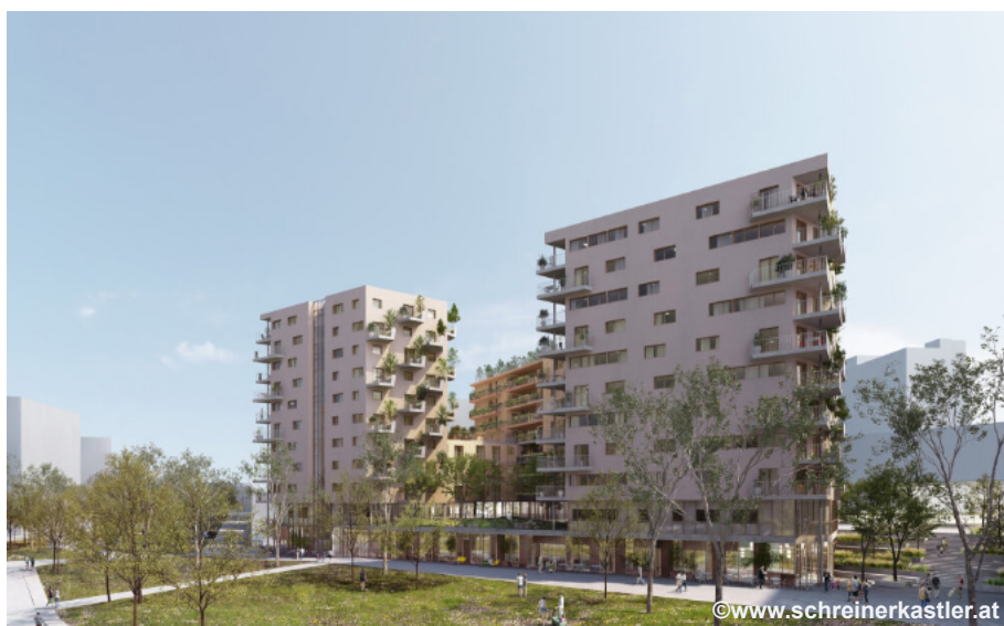
Stand: 08/2021 / Änderungen vorbehalten