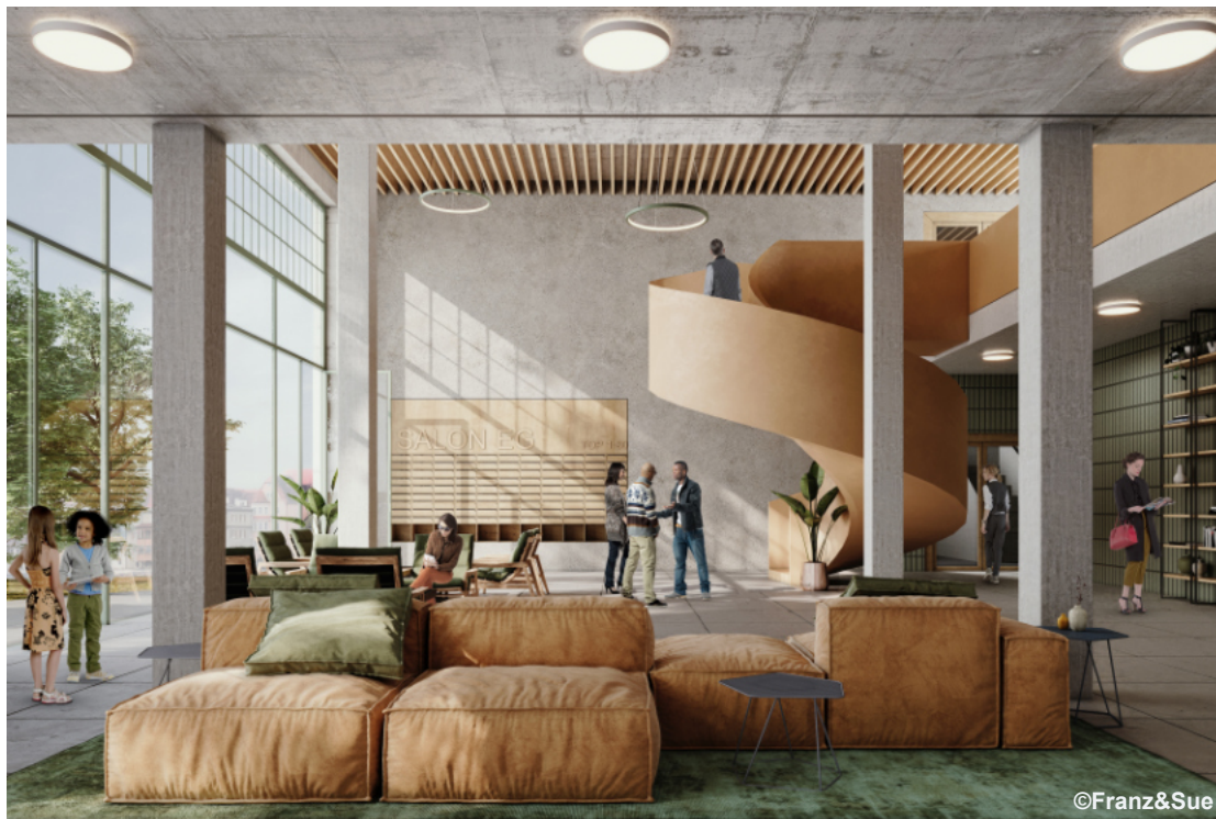
Stand: 08/2021 / Änderungen vorbehalten