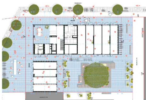
Schaubild C.17.A (© Studiovlay ZT GmbH)